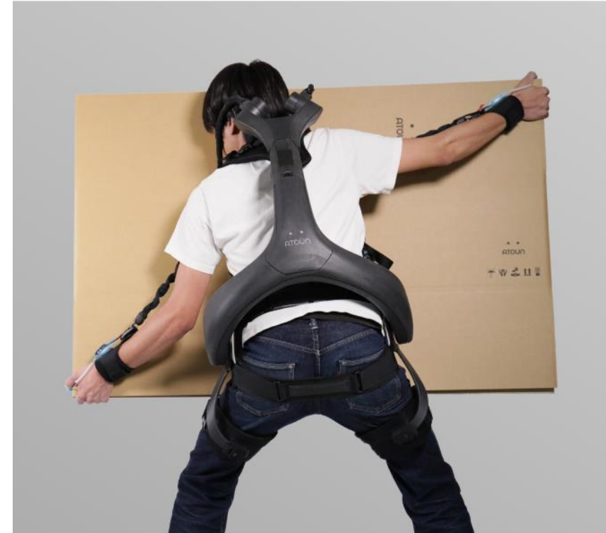
パワードウェア ATOUN MODEL Y + kote