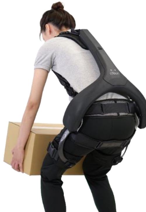
パワードウェア ATOUN MODEL Y