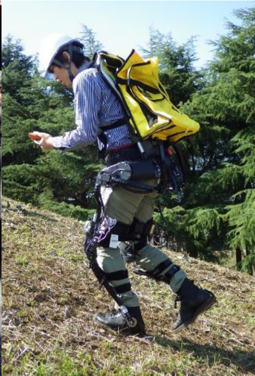
林業用パワードスーツ TABITO